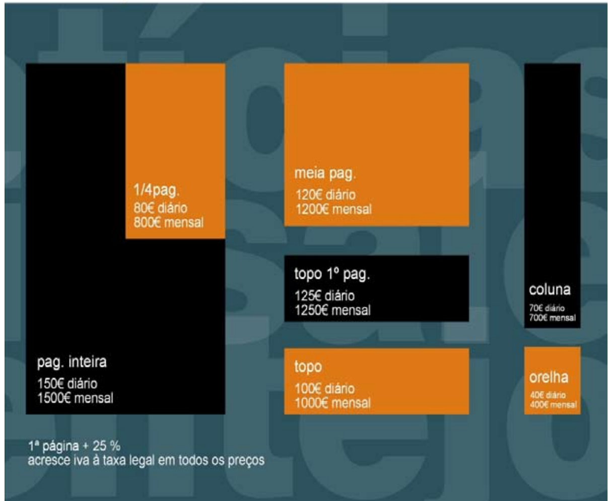
tabela de publicidade